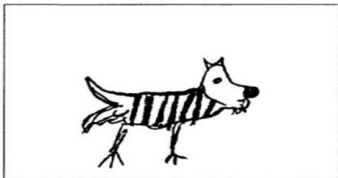
Рисунок тихой, замкнутой девочки.

По положению на листе ( нижняя часть ) мы видим, что ребенок неуверен в себе, имеет низкую самооценку, подавлен, не заинтересован в своем социальном положении, отсутствует тенденция к самоутверждению.